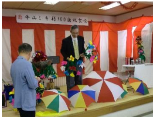
手品によるマジックショー