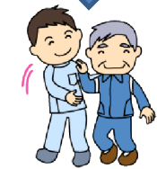
個別リハビリテーション

シャワー浴や、広々とした浴槽に入浴ができます。リフト浴も設置しており車椅子の方も入浴が可能です。看護師の介助のもと、衛生管理も行います。