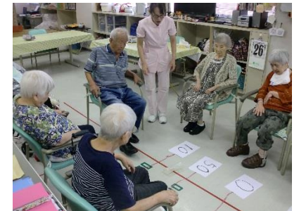
看護師によるレクリエーションの様子