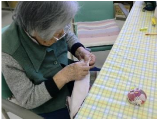
製作活動(手芸、刺し子、書字等)