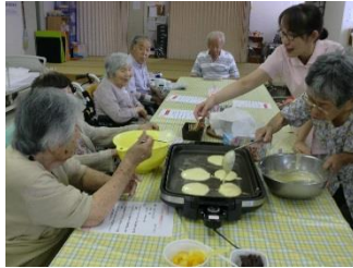
お菓子作り・調理